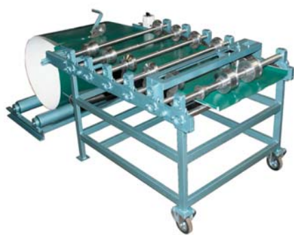
Мобильный кровельный фальцепрокатный станок «МобиПроф», модель СФП-700

недоступности производственного оборудования для обеспечения минимального уровня качества, тем самым привнося свои «замечательные» изменения, адаптируя процесс производства под свою станочную базу и минимизируя конечную себестоимость продукции. В результате получается «клон», очень похожий на модели лидеров отрасли, но одновременно имеющий множество отличий, которые, на взгляд пирата-производителя, совсем не важны. Именно эти мелочи, за наличие которых так серьезно бьются истинные мастера своего дела, полученные за долгие годы постоянного совершенствования оборудования, и отличают плагиат от оборудования, способного производить качественные изделия. И именно поэтому каждый уважающий себя производитель не только имеет свое монтажное подразделение, в нашем случае по монтажу фальцевой кровли (например, Schleich, Dimos, «МобиПроф»), чтобы постоянно самому обкатывать и испытывать нововведения в конструкции, но и старается участвовать во всевозможных строительных выставках, задача которых состоит не столько в ознакомлении клиентов с новинками, сколько в получении такой необходимой обратной связи о работе станков, что, в конечном итоге, и будет являться тем бесценным опытом, который компания — производитель постоянно воплощает в своих изделиях.