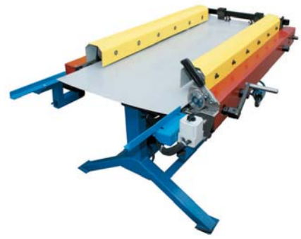
Мобильный кровельный фальцепрокатный станок «МобиПроф», модель СФПР

В-седьмых, надо четко разграничивать цели и задачи, которые вы преследуете при покупке кровельного станка. Если предполагаемым местом использования станка является стройплощадка, а сам станок будет использоваться на улице во влажной и агрессивной среде, если вы будете все время работать с оцинкованным металлом или оцинковкой с полимерным покрытием, и процесс покупки и раскроя металла будет происходить у одних и тех же поставщиков на одну и ту же ширину, да и сам станок будет перемещаться с одного объекта на другой без постоянно прикрепленного к нему обслуживающего персонала, то не плохо