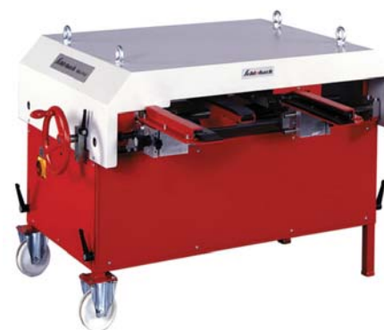
Кровельный фальцепрокатный станок Schleich, модель Mini-Prof

своего оборудования на вновь появившемся металле и постоянно изменяет не только конфигурацию формирующих роликов, но вводит как дополнительные формирующие, так и калибрующие переходы. Например, даже на самых легких моделях Schleich, таких как Mini-Prof, в конце профилирующего механизма, на выходе из станка, находятся регулируемые пластиковые ролики, которые позволяют производить тонкую подстройку станка на необходимую жесткость металла для обеспечения линейности панелей на выходе. Таким образом, прокатывая металл даже одной и той же толщины, всегда необходимо следить за линейностью панели и поправлять ее, чтобы уменьшить эффект волны на кровельной карте, который явно проявляется лишь после процесса монтажа.