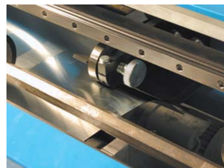
Роликовый нож для продольной подрезки профилируемой заготовки станка Dimos, модель Dipro-1S

В-пятых, попытка некоторых не очень добросовестных производителей и продавцов пустить пыль в глаза покупателей, преподнося, на их взгляд, существенное преимущество оборудования, фактически являющееся существенным недостатком. Например, всем известно, что поставляемый металл в рулонах имеет определенный допуск по ширине. Так, на ширину рулона 1250 мм допуск может доходить до ± 5 мм. Тем самым, порезав рулон пополам одной парой ножей, применительно к использованию для фальцевой кровли, мы получаем половинчатый интервал допуска, т.е. ± 2,5 мм. Наличие же данного интервала